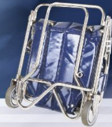
PP bleue pliée