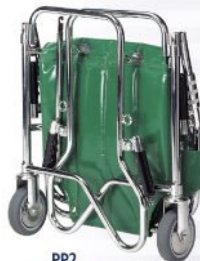
PP2 verte pliée

Conforme aux normes : NF EN 1865 et NF EN 1789