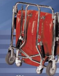
PP4 rouge pliée

Chaise portoir pliable. Réf. PP4 Fabriquée en acier chromé, équipée de 4 roues (2 roues fixes diam. 125 mm à l'arrière et 2 roues pivotantes diam. : 60 mm. à l'avant dont une équipée d'un frein). 4 poignées ergonomiques, rabattables dont 2 sont positionnées sur l'arrière du dossier et 2 sur la face avant des montants latéraux pour permettre le portage à la main. Munie de 4 œillets pour le portage par bretelles BST, de 2 sangles de maintien (buste et cuisses) avec boucle plastique à clipage rapide et d'un repose-pieds de sécurité. Sellerie identique à la chaise portoir réf. PP. Testée à 250 kg de charge en statique et dynamique. Coloris disponibles : Jaune, Bleu, Vert, Rouge. Hauteur dépliée : 103,5 cm. Hauteur pliée : 58,7 cm. Largeur (pliée ou dépliée) : 50,5 cm. Epaisseur pliée : 17 cm. Profondeur de l'assise : 49 cm. Poids : 9,5 kg.