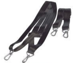
Bretelles de portage. Réf. BST (le jeu de 2 paires)